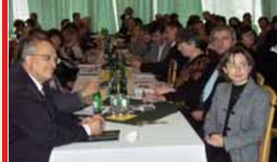
Stretnutie riaditeľov KŠ