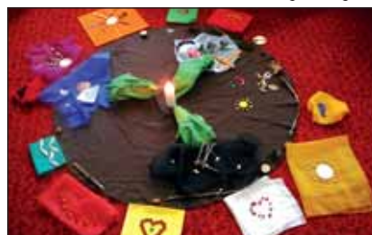
Práce účastníkov vzdelávania „Integratívne biblické vyučovanie a prístupy ku kreatívnej činnosti.“

V tomto školskom roku ponúkame nové 30-hodinové priebežné vzdelávanie „ Spiritualita riaditeľa katolíckej školy “. Je určené predovšetkým pre vedenie katolíckych škôl, ktoré má prenášať spirituálny rozmer do celého pedagogického kolektívu. Prvé stretnutie sa uskutoční 13.-14. decembra 2007 v Spišskej Kapitule. Druhé, záverečné, sa uskutoční v marci 2008. Na toto vzdelávanie sa môžete prihlásiť prostredníctvom internetu na adrese kpkc@kpkc .