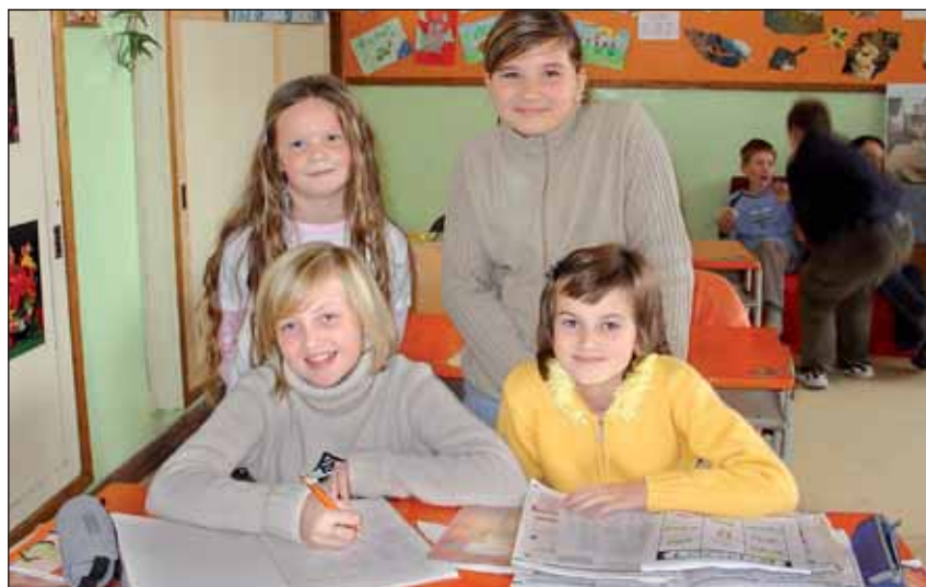
Žiaci ZŠ v Bojniciach

Dynamika špirály učebných osnov náboženstva/náboženskej výchovy pre stredné školy pokračuje tematicky na objavenie osobnej dôstojnosti v obsahoch – dôstojnosť ľudskej osoby od počatia, význam pohlavnosti (1. ročník SŠ). Objavenie osobnej dôstojnosti privádza k objaveniu osobnej hodnoty, žiak sa oboznamuje s témami čistoty, prvotnej jednoty muža a ženy, spoločensťva (človek ako dar pre človeka) a s témou rodiny ako archy záchranu ľudstva (2. ročník SŠ). Cesta dozrievania mladého človeka pokračuje k objaveniu vlastnej identity (3. ročník SŠ) v témach, zameraných na poznávanie seba a Boha – ces-