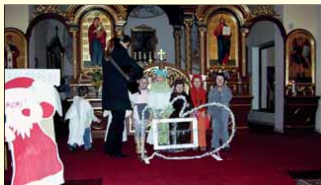
Cirkevná materská škola blahoslaveného biskupa Vasiľa Hopku