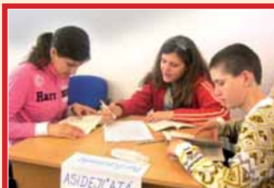
Diecézne katechetické úrady