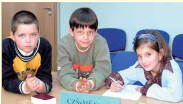
Exarchátne (krajské) kolo Biblickej olympiády v r. 2006

Vznikla transformáciou Stredného odborného učilišťa a Dievčenskej odbornej školy 1. septembra 2004. V snahe nadväzovať na všetko pozitívne, čo bývalé školy dosiahli, pripravuje škola v súčasnom období žiakov v dvojročných učebných odboroch: strojárka výroba a výroba konfekcie; v trojročných učebných odboroch hostinský - hostinská, kaderník, cukrár, autoopravár mechanik, predavač, strojní mechanik, mechanik opravár - cestné motorové vozidlá, dámske odevy, ako aj v študijných odboroch: hotelová akadémia (5-ročné štúdi-