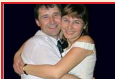
Projekt „Felix Familia“