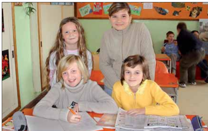
Žiaci ZŠ v Bojniciach

Dynamika špirály učebných osnov náboženstva/náboženskej výchovy pre stredné školy pokračuje tematicky na objavenie osobnej dôstojnosti v obsahoch – dôstojnosť ľudskej osoby od počatia, význam pohlavnosti (1. ročník SŠ). Objavenie osobnej dôstojnosti privádza k objaveniu osobnej hodnoty, žiak sa oboznamuje s témami čistoty, prvotnej jednoty muža a ženy, spoločensťva (človek ako dar pre človeka) a s témou rodiny ako archy záchranu ľudstva (2. ročník SŠ). Cesta dozrievania mladého človeka pokračuje k objaveniu vlastnej identity (3. ročník SŠ) v témach, zameraných na poznávanie seba a Boha – ces-