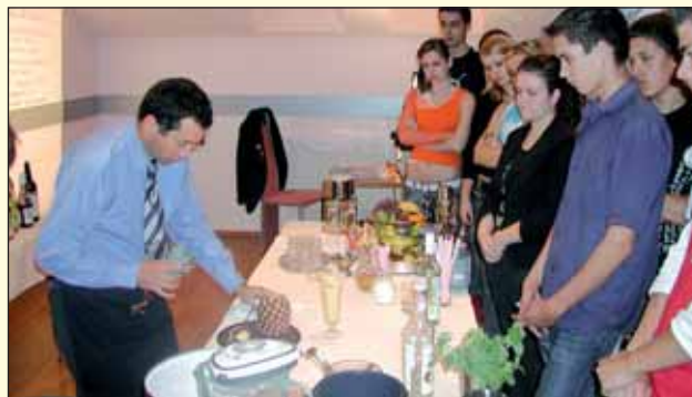
CZŠŠ sv. Jozafáta v Trebišove