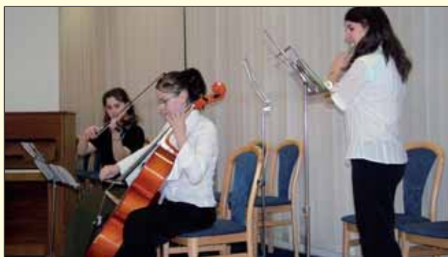
Žiaci Katolíckej strednej pedagog. školy sv. Cyrila a Metoda v Košiciach